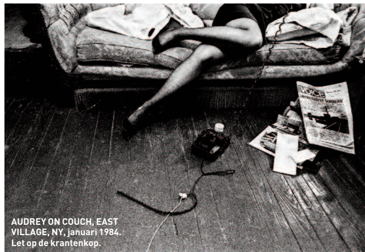
AUDREY ON COUCH, EAST VILLAGE, NY, januari 1984. Let op de krantenkop.